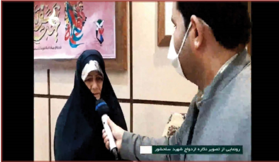
رونمایی از تصویر نگاره ازدواج شهید ساحشور