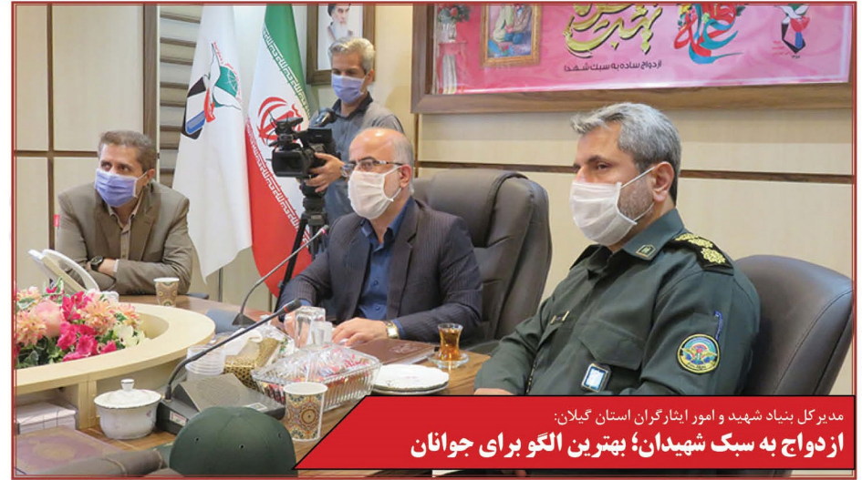
مدیرکل بنیاد شهید و امور ایثارگران استان گیلان: ازدواج به سبک شهیدان؛ بهترین الگو برای جوانان

عنوان الگو برای جوانان و سوق دادن جوانان به ازدواج به سبک شهیدان، یک ضرورت است. جمع‌آوری اسناد شهدا در استان گیلان ادامه دارد و ما از این اسناد برای انتقال فرهنگ و سیره شهدا به جوانان امروز بهره می‌گیریم. امیدواریم بتوانیم در ترویج فرهنگ ایثار و شهادت و معرفی شهیدان به عنوان الگو برای نسل جوان موفق باشیم و دین خود را به ایشان ادا کنیم.