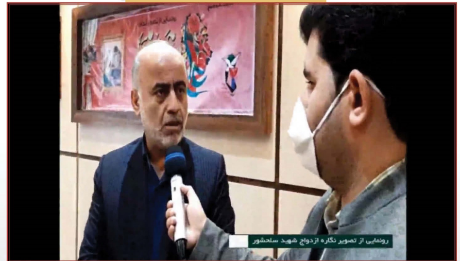
رونمایی از تصویر نگاره ازدواج شهید ساحشور