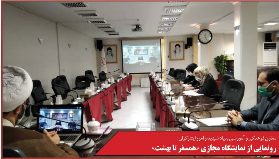
معاون فرهنگی و آموزشی بنیاد شهید و امور ایثارگران: رونمایی از نمایشگاه مجازی «همسفر تابشت»

همه این‌ها از آیات الهی است و الگوئی بهتر از شهدای برای نمایش این آیات الهی وجود ندارد.